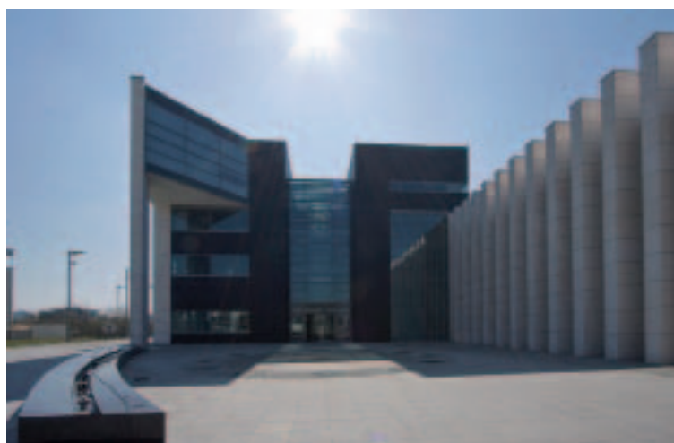
Siège du groupe Comarch.