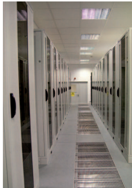
Salle de serveurs dans l'un des Datacenters de Comarch.