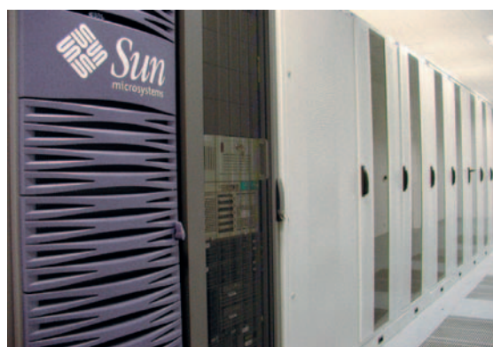
Serveurs de dernière génération utilisés par Comarch

L'entreprise s'investit pour contrôler l'impact de ses émissions de carbone en mesurant la consommation électrique et en introduisant des initiatives destinées à maximiser l'efficacité énergétique.