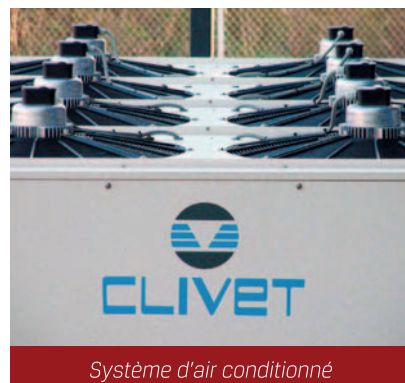
Système d'air conditionné