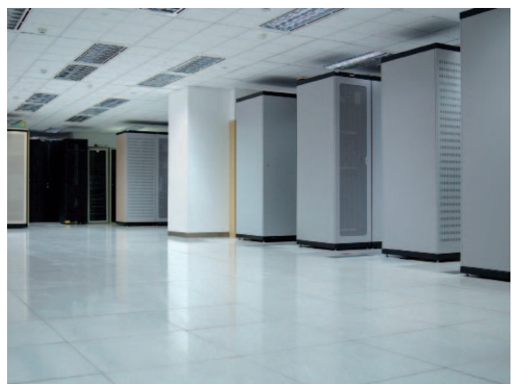
Aperçu d'une salle "blanche" intégrant les serveurs de Comarch.