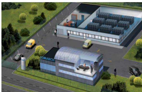
Datacenter de Comarch France - Surface de 2200 m 2

Des milliards de téraoctets de données échangées chaque année